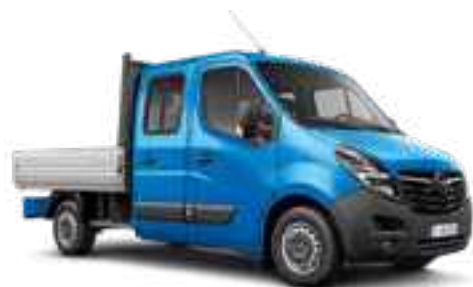
Bleu Électrique 1