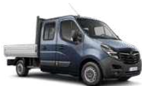
Bleu Ambiance 3