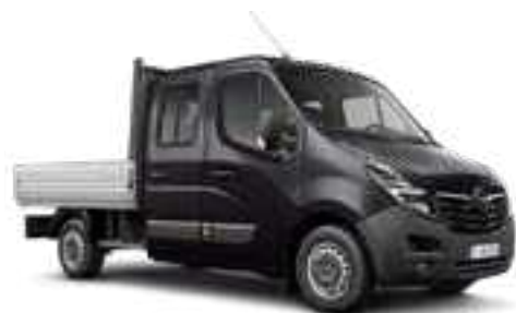
Noir Perle 2