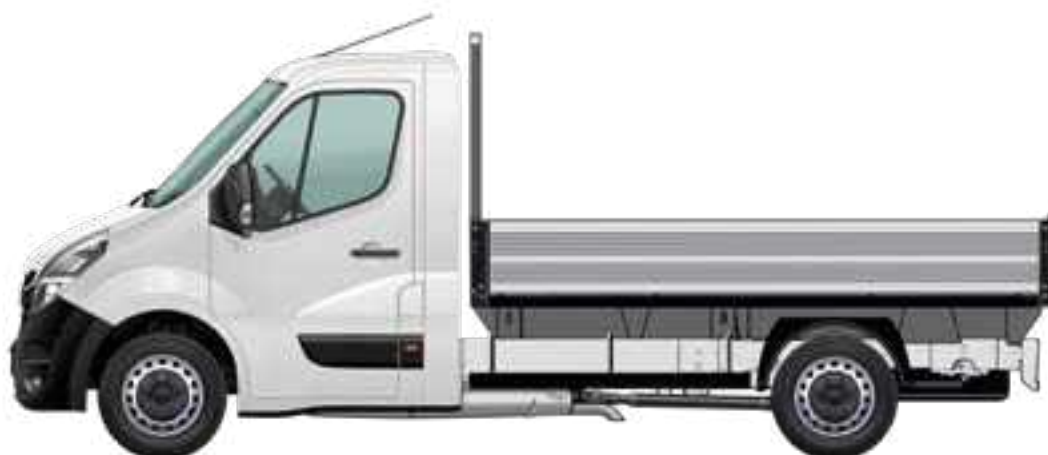
Plateau ridelles sur châssis cabine