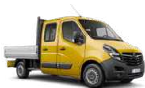
Jaune Safran 1