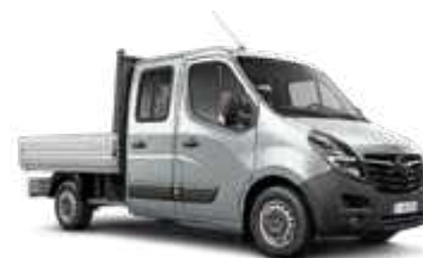
Gris Aluminium 2