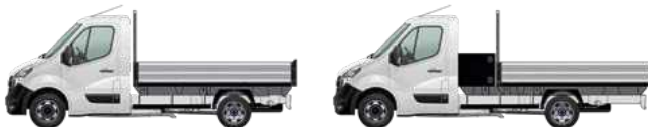
Benne sur châssis cabine

Certains de ces équipements sont en option.