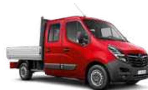
Rouge Dahlias 1