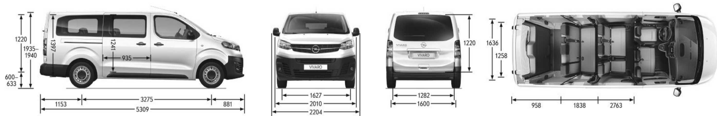
Vivaro Combi L3